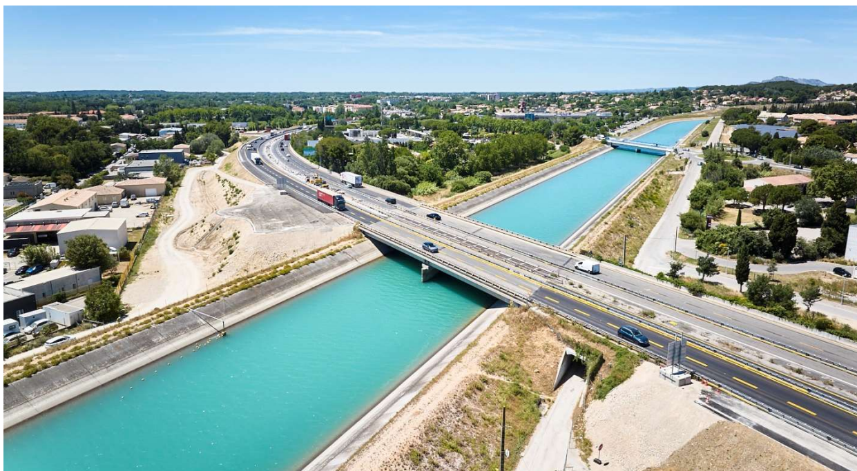
Vue aérienne de l'ouvrage, qui sera élargi, situé rue Conrad Chastel sous l'A54.

VINCI Autoroutes poursuit le chantier d'amélioration de la bifurcation A7/A54 dans le secteur de Salon-de-Provence. Ce chantier prévoit des travaux d'élargissement à 2 voies de la bretelle reliant l'autoroute A54 à l'A7 en direction de Marseille. Pour réaliser cette deuxième voie sur A54, l'ouvrage passant sous l'A54 doit être allongé. Les travaux sur cet ouvrage vont nécessiter la fermeture partielle de la rue Conrad Chastel du 16 septembre au 20 décembre 2024. Un itinéraire de déviation sera mis en place pendant toute la durée des travaux.